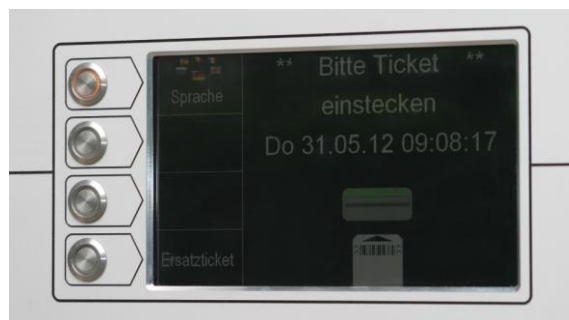
Detail: 9 Zoll Farbdisplay