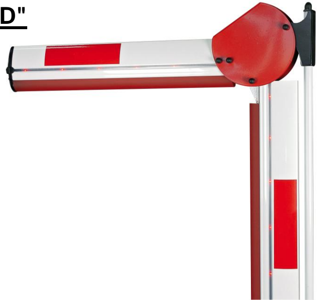
Abb. zeigt Option Holm mit Beleuchtung